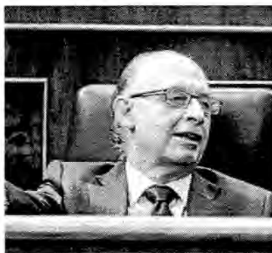
Cristóbal Montoro, en su escaño del Congreso durante una reciente sesión de control al Ejecutivo.

El PP es partidario de recuperar la deducción fiscal por compra de vivienda habitual para todos los contribuyentes y, si gana las próximas elecciones generales, lo hará incluso con efectos retroactivos. Así lo explicó ayer el coordinador económico de los populares, Cristóbal Montoro, quien aclaró que el objetivo es extender la deducción a las viviendas adquiridas en el 2011, año en el que el Gobierno socialista solo ha mantenido ese beneficio fiscal para las rentas más bajas. Con el anuncio, el PP busca evitar un posible parón de la compra de viviendas en el 2011 en espera del triunfo que las encuestas auguran a Mariano Rajoy en las próximas elecciones.